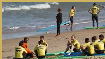
Paddle, Surf et voile